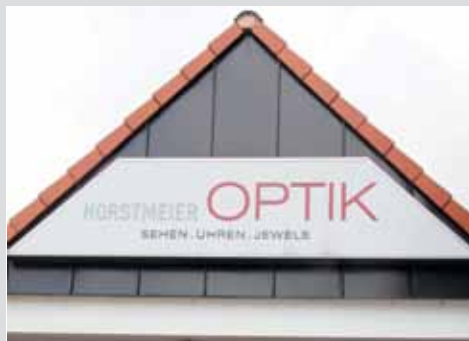
Für den perfekten Durchblick: Optik Horstmeier in Hille Seite 11