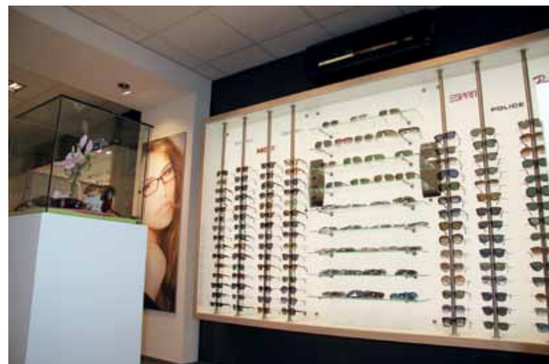
Bei Optik Horstmeier an der Mindener Straße 67 in Hille gibt es eine große Auswahl an modischen Brillen.

Mo., Di., und Do., Fr.: 10.00 Uhr bis 18.00 Uhr, Mi. und Sa. 10.00 Uhr bis 13.00 Uhr