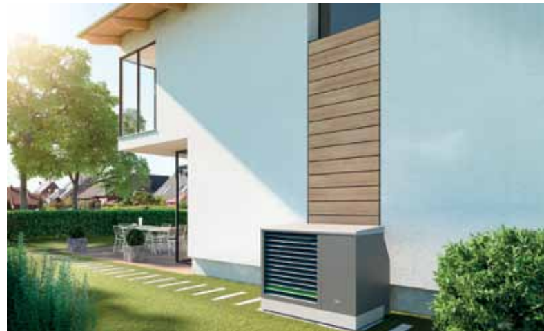
Für jede Anforderung die passende Wärmepumpe – bis zu 45 Prozent förderfähig: Die hocheffiziente Luft-Wasser-Wärmepumpe kann z. B. je nach Modell im Heizungskeller oder auch im Garten installiert werden.

Weitere Informationen finden Bauherren und Modernisierer auch auf www.kermi.de/klimapaket .