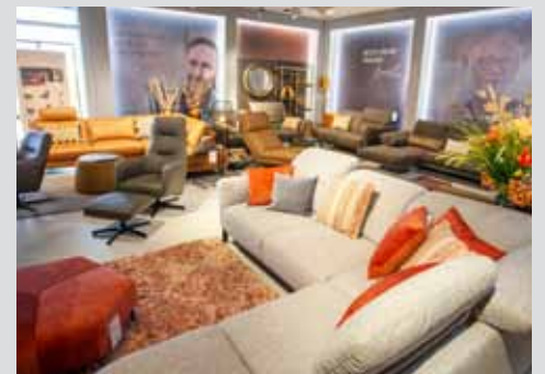
Polster Peper wird in diesem Jahr 90 Jahre jung Seite 15